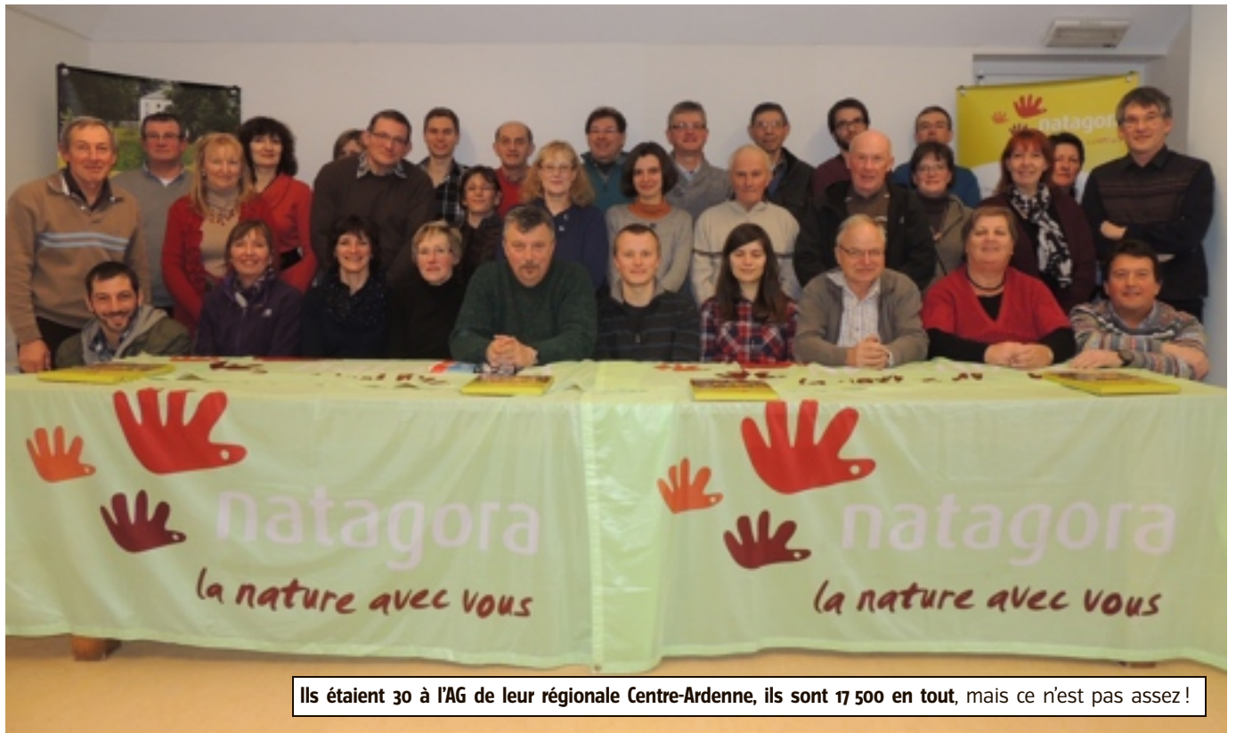
Ils étaient 30 à l'AG de leur régionale Centre-Ardenne, ils sont 17 500 en tout, mais ce n'est pas assez !